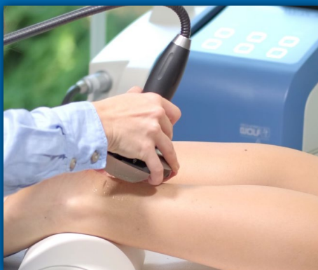
Bild 1: Ultraschallgestützte Hautmarkierung zur Lokalisation des Zielgebiets.