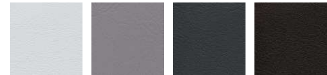
perle F6461288 chrom F6461205 anthrazit F6461197 schoko F6461357