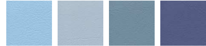
dolphin F6461609 stone F6461608 bleu F6461496 sky F6461581