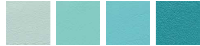
mint F6461495 aqua F6461456 türkis F6461338 agave F6461273