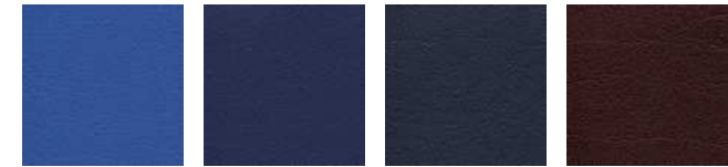
atoll F6461453 royal F6461196 ocean F6461204 bordeaux F6461350