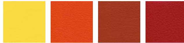
limonade F6461343 orange F6461556 karneol F6461557 feuer F6461454