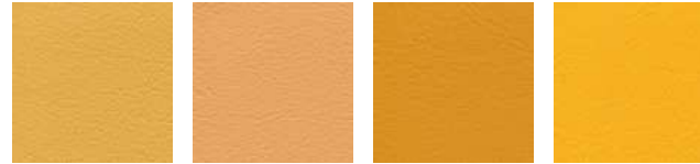
mais F6461457 apricot F6461458 mango F6461607 safran F6461542