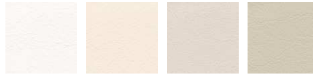
weiss F6461198 beige F6461636 creme F6461210 sand F6461230