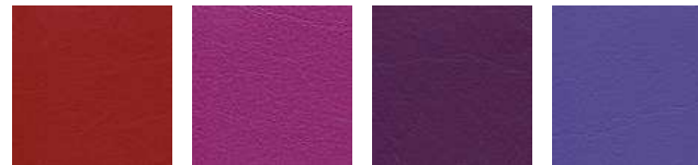
kirsche F6461199 cyclame F6461381 orchidee F6461354 violett F6461356